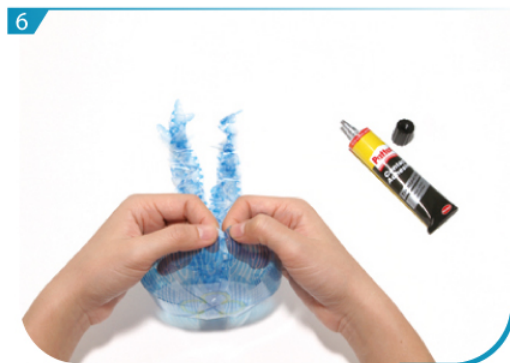
按組合說明，把J02的外圈摺疊貼合成身體。