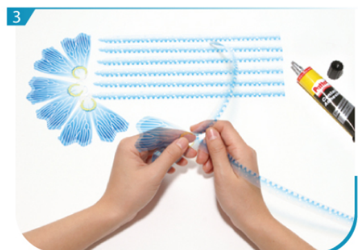
按組合說明，把J02及J05黏合。