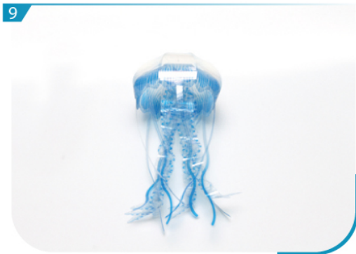
美麗的水母即時顯現眼前。