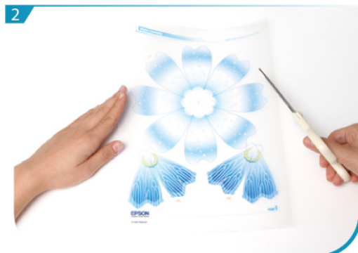
沿線剪出所有組件。