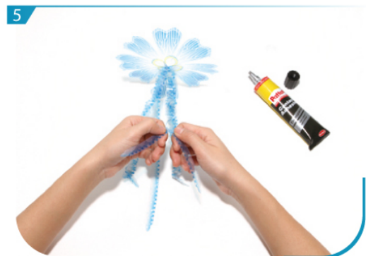
按組合說明，把J05左右交叉對疊，然後把底部黏合。