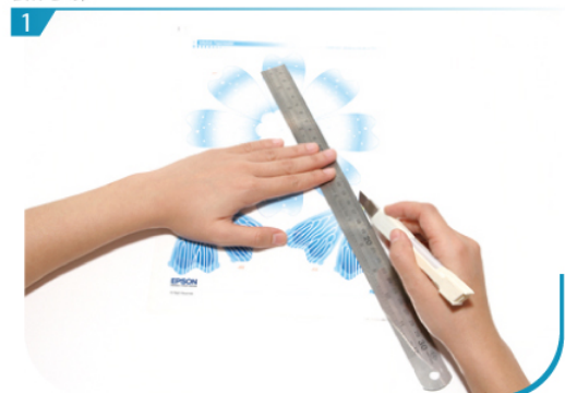
請用透明膠片打印出第一頁、第二頁及第三頁，並用剉刀於膠片上劃一下摺線。