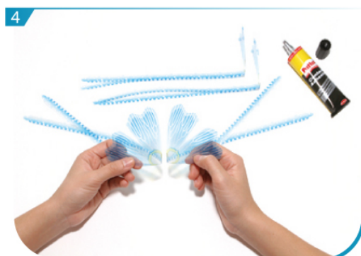
按組合說明，把J02黏合。